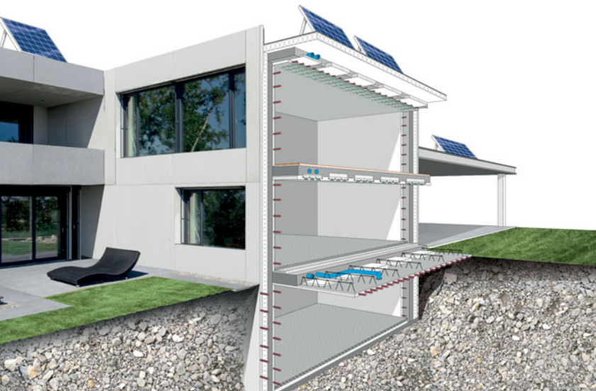
Aufbau Green Code System