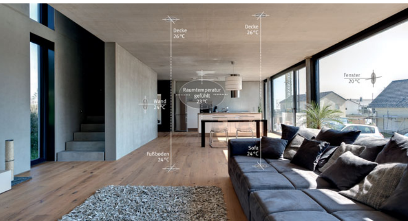
Green Code Decke