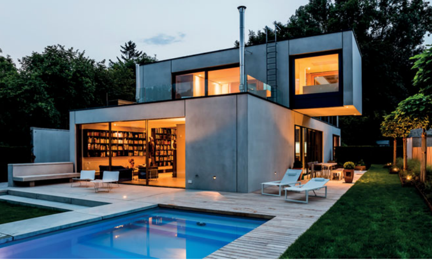
Einfamilienhaus in München mit Green Code System